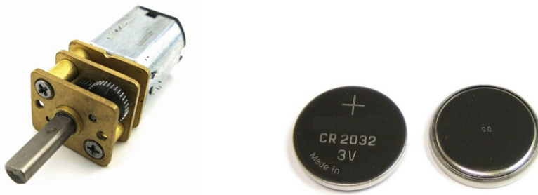
图 2 电动机和电池

2. 装置动力系统的电动机和电池采用指定型号 ( 电动机 N20 减速电动机, 3V, 100 转/分钟, 数量 1 个; 电池: CR2032, 数量不超过 2 个, 不指定厂家, 见图 2)。电子元件 ( 只能是开关、电池底座) 及涉及运动的机械零件 ( 如不可拆解的齿轮、齿条、轴等) 可以自行采购。除电动机电池外不得安装其他使用电能的装置, 小车的所有动力均通过电动机输出。